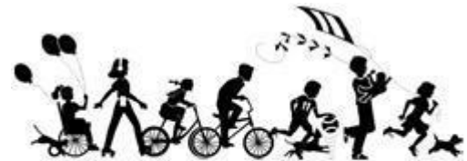
FOSTER & KINSHIP CARE EDUCATION PROGRAM AT LOS ANGELES CITY COLLEGE